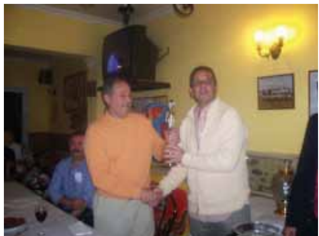
Trofeo al mejor criador