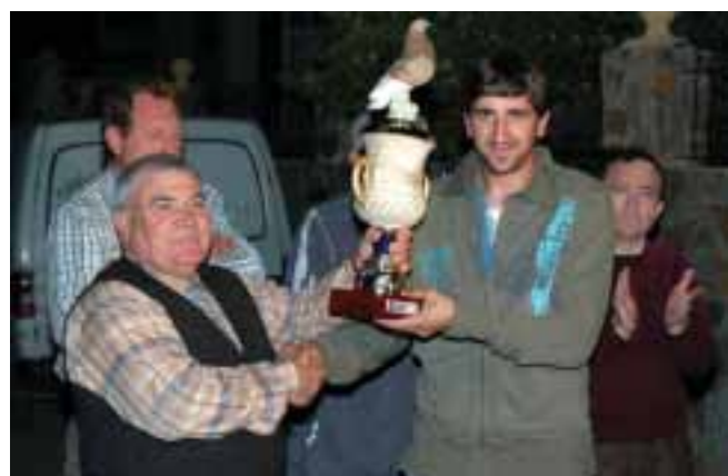
Segundo clasificado en la competición recogiendo su trofeo