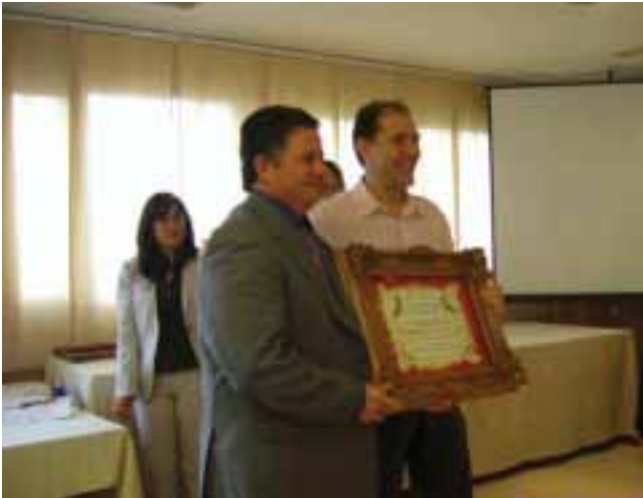
El presidente de la Delegación de Castellón entrega una de las placas acreditativas durante la comida de hermandad