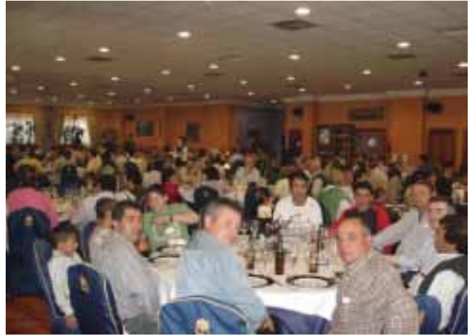
Comida en el Regional de Murcia