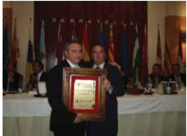
El presidente de la RFEC y el presidente de la FCCV.