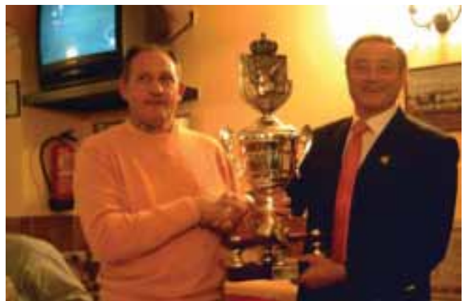
Trofeo para el ganador del Regional

Y con mis saludos y buenos deseos para todos y en particular a los participantes en el Campeonato de España Copa S.M. el Rey, glosó en verso, como siempre, mi SENTIR PALOMISTA: