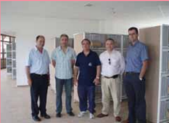
Visita a las instalaciones de autoridades

El Campeonato se desarrollará desde el 30 de junio hasta el 14 de julio.