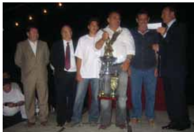
Ganadores recogiendo su trofeo