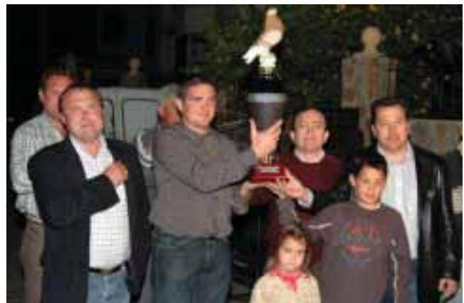
Ganadores del Campeonato Al Andalus 2007