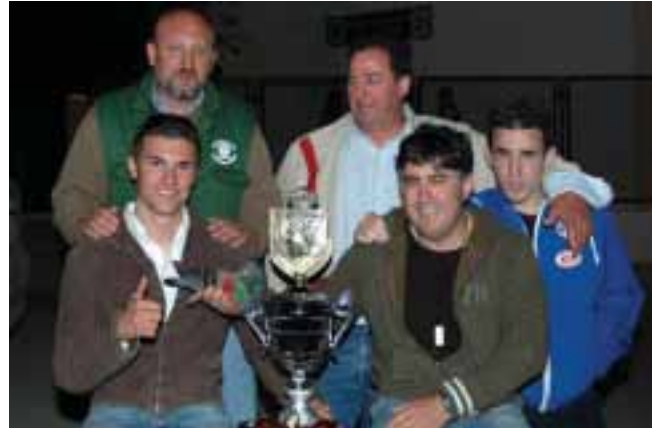
Propietarios del tercer clasificado en la competición con su trofeo

La paloma sale volando muy fuerte y se marcha rápida, dejando varios palomos en el pueblo, en dirección a la Rambla del Majalejo, pero al rato vuelve al pueblo y recoge a los que se habían quedado. Realiza varias paradas en los