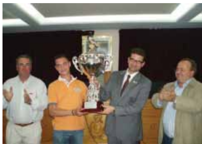
El ganador del provincial de Valencia recoge su trofeo de manos del Alcalde junto al presidente de la Delegación de Valencia y el Presidente de la Federación de la Comunidad Valenciana.

Varias son las cuestiones que han conducido a este provincial de Chiva al éxito. Entre ellas, la participación activa de policía local y Guardia Civil que han controlado la competición en todo momento, además, los aficionados pudieron contar con una zona de aparcamiento y un servicio de autobuses constante que comunicaba esta zona con el casco urbano. El Club invitó todas las tardes a los aficionados a una merienda con la que se entregaba un ticket con el que se entraba en un sorteo de dos viajes al Caribe. Contando con la celebración de este Provincial, otro de los atractivos fue la celebración de la primera Feria de la Colombicultura en Chiva el día de la final el 28 de abril. En esta Feria hubo stands con alimentación, cajones y materiales y productos relacionados con el mundo del palomo además de una exposición de palomas de raza procedentes de toda la