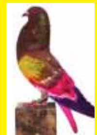
3.º MÁS VITAL Peña debajo de la Noguera