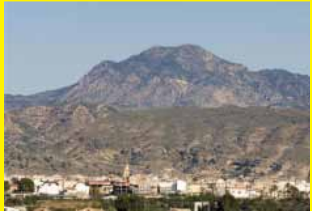
Vista general de Fortuna

La Cena de Gala se celebra en el Restaurante El Casón de la Vega, amenizado por el grupo folklórico murciano Los Parramboleros. (Ctra. de Santomera-Abanilla 414 Km 2,8 de Santomera) Ya el día 2 de junio se celebrará la comida de hermandad en el Restaurante El Casón de la Vega. A las 19:00