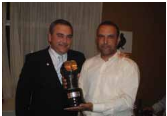
El presidente de la RFEC entregó el Trofeo Consejo Superior de Deportes al mejor clasificado con mayor puntuación del Campeonato de España