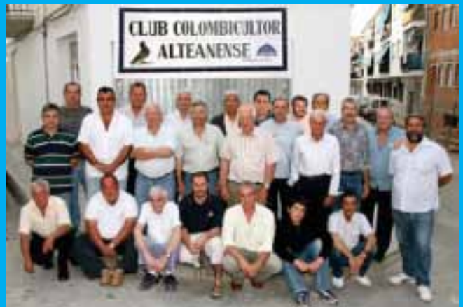
Socios del Club frente a la sede