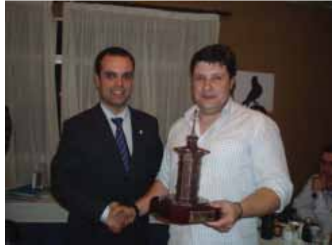
El deportista gallego mejor clasificado recogió su premio

Otro de los puntos fuertes de este Campeonato de España ha sido la celebración de actos sociales. La organización lo tuvo todo previsto y preparó un completo programa que se inició el día 9 con la inauguración oficial de la exposición. El sábado 10 de marzo, mientras se realizaba la