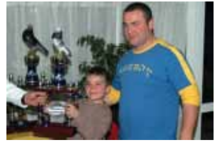
Primero en el Provincial de Granada