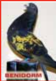
1.º BENIDORM Peña Calicasas