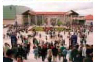
Distintas imágenes de la pasada edición