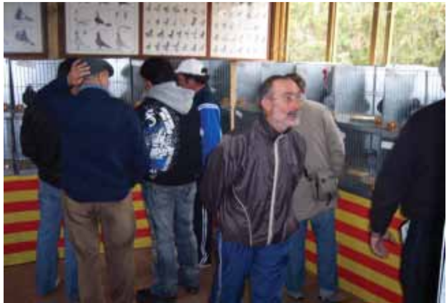
Vista de la exposición y expositores