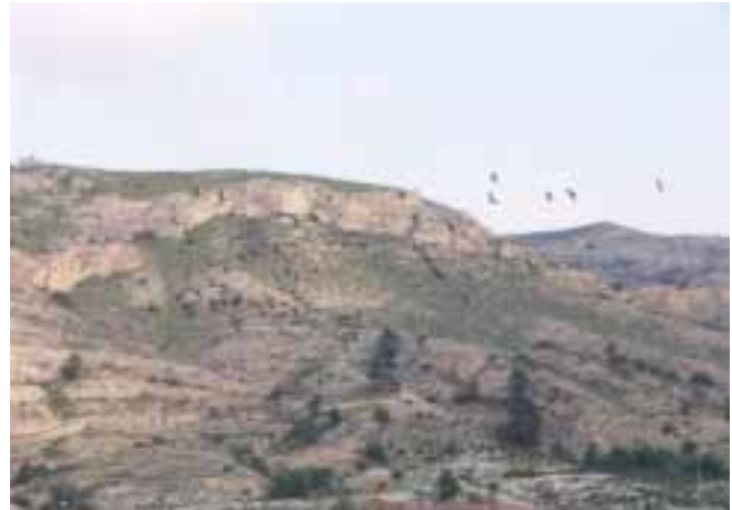
Durante la celebración de la competición