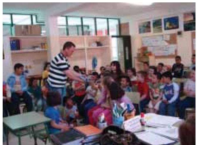
Los niños escucharon con atención

Todos han quedado invitados a presenciar ellos mismos la realización de las pruebas deportivas del campeonato regional juvenil que se van a celebrar en Galifa. En la imagen se pueden ver a los alumnos del Colegio Público