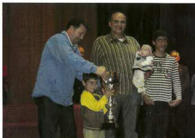
El segundo clasificado recogió muy bien acompañado su trofeo

"Aburrida de estar allí, al no poder quitarse a los palomos, volvió a los camiones subiéndose a un trailer y quedándose con tres palomos. Al poco tiempo conectaron el resto de palomos y haciendo un vuelo corto se metió bajo otro camión empotrándose en la parte trasera del camión", señala el árbitro titular quien recuerda que: "dificultó la labor de los árbitros para puntuar por