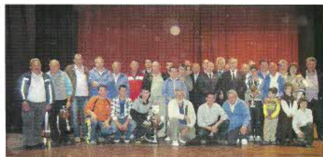
Ganadores junto a las autoridades deportivas del Campeonato