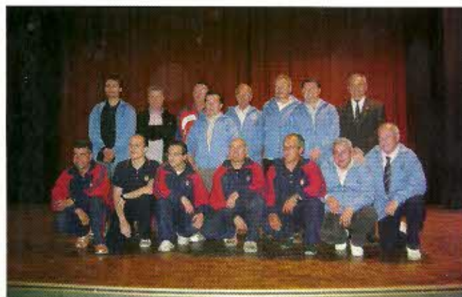
Equipo arbitral junto con la Comisión Organizadora

las muchas desconexiones cortas de tiempo y de difícil visibilidad". Allí se terminó la prueba.